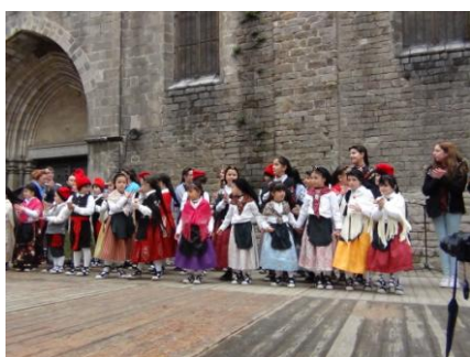
FESTES DE SANT JOSEP ORIOL. Actuació de les Seccions Infantil i Juvenil

TALLERS DE DANSA A L'ESCOLA CERVANTES. Per a nens i nenes de 5è de Primària, amb la participació dels mestres de dansa de l'Esbart Català de Dansaires. Lloc: Sala de ball de La Casa dels Entremesos.