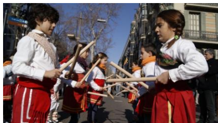
FESTES DE SANTA EULÀLIA 2015. SEGUICI DE SANTA EULÀLIA. Amb la participació dels Cavallets Cotoners i les colles de bastoners Infantil, Juvenil i Gran

SANTA MARIA DE PALAUTORDERA. 5è Aniversari Ball de les Gitanes. Amb la participació del Cos de Dansa. Lloc: Santa Maria de Palautordera. Acompanyament musical: Cobla Ciutat de Granollers.