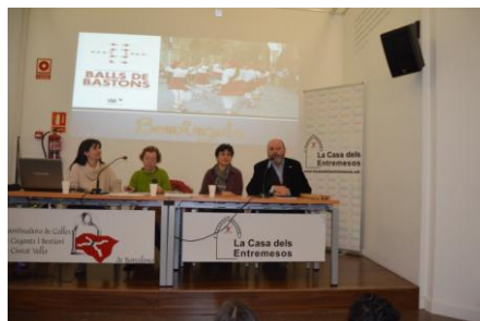
PRESENTACIONS 2015. Presentació del Manual de descripció coreogràfica de balls de bastons

LA DANSA TRADICIONAL. COL-LOQUI. Amb la participació de components de l'Esbart Català de Dansaires. Lloc: Biblioteca Dos Rius de Torelló.